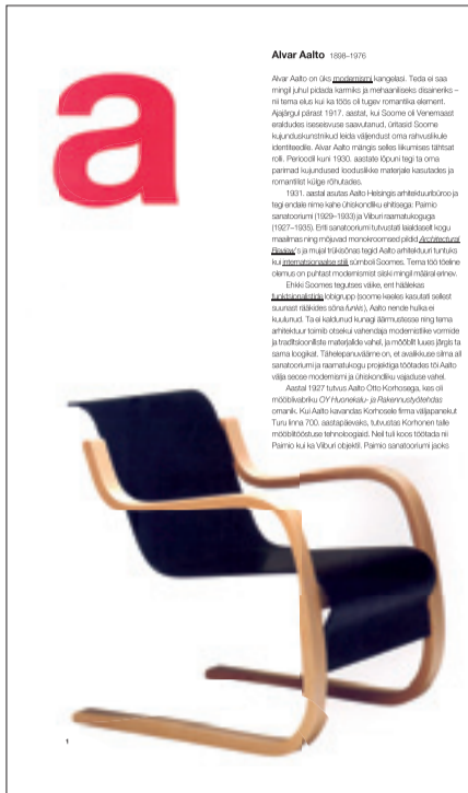
Alvar Aalto 1958-1976

Raamat algab kaheksa peatükiga disainiajaloo