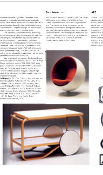
Eero Aarnio 1952

disaini Alvar Aalto, millel on kaasaegsete raamatute ja ajakirjade disainiloo. Tema teosed on loonud disaini- ja arhitektuuriloo. Tema teosed on loonud disaini- ja arhitektuuriloo.